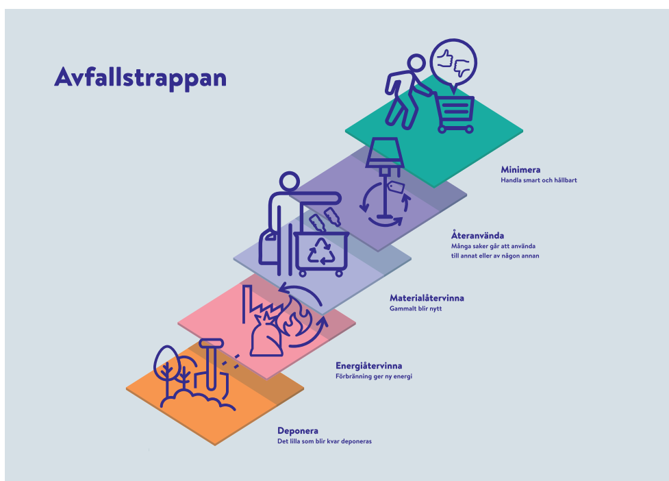
Figur 4 Avfallstrappan, även kallad avfallshierarkin. Vi strävar efter att röra oss uppåt i trappan.

Avfallsplanens mål utgår från EU:s avfallshierarki, eller avfallstrappan som den också kallas. Det betyder att avfall i första hand ska förebyggas och därmed minimeras. I andra hand ska saker återvändas och i tredje hand materialåtervinnas, dvs bli till nya produkter. I fjärde hand ska avfall energiåtervinnas, alltså förbrännas eller behandlas på annat sätt så att energi tas till vara. I sista hand ska avfall läggas på deponi, det vi ofta kallar soptipp.